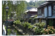
熱海温泉 伊豆長岡温泉 下田温泉