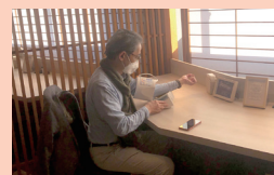
宿泊前の健康状態の取得