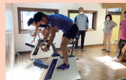
運動パフォーマンスの計測