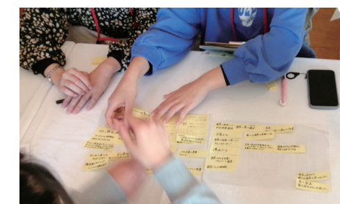
令和4年度モニター講座でのワークショップの様子

※(公社)ふじのくに地域・大学コンソーシアムの単位互換協定校の学生が受講可能な単位互換授業として開講